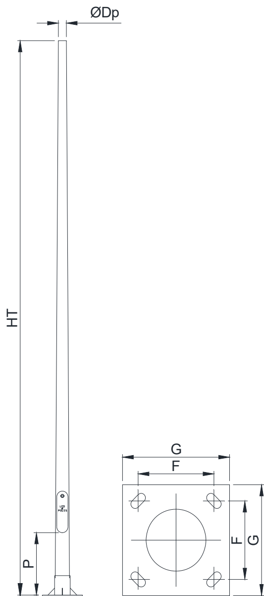
TABLA DIMENSIONAL (continuación)